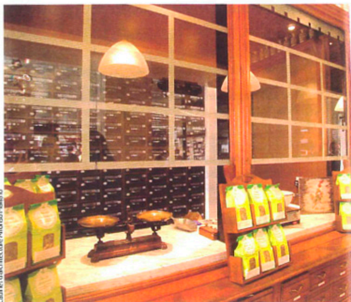
Cabinet d'architecture Alfonso Maligno

Alfonso Maligno s'est inspiré de l'ancienne herboristerie, créée en 1905 par M. Losson, pour faire de cette officine un lieu dédié au bien-être. Le préparatoire et ses anciens meubles aux « mille » tiroirs, l'ancienne balance et les outils sont mis en scène dans un espace d'antar. Le bois de chêne, un ancien vitrage coloré, des images sépia représentant des laboratoires de l'époque contribuent à concrétiser la scénographie visant à mettre en avant la tradition source de bien-être tout en valorisant les services proposés par les titulaires, M et Mme Vuillaume.