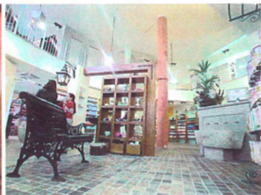
Cabinet d'architecture Alfonso Maligno